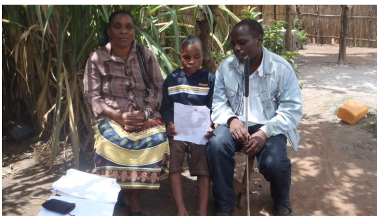
Foto: Kevene Marcos Farahane com Delegada e Secretário Provincial da ACAMO - Niassa